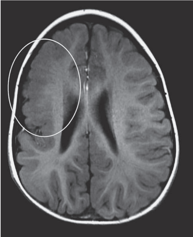
SLIKA 2. MRI mozga prvog bolesnika

oko vrata. Majka je intrapartalno primala antibiotik. Dječak je liječen antibioticima zbog kasne perinatalne infekcije meticilin rezistentnim zlatnim stafilokokom i ESBL (extended spectrum beta lactamase) Klebsiellom pneumoniae , ali bez infekcije središnjeg živčanog sustava. Na UZV-u mozga u novorođenačkoj dobi uočeno je intrakranijsko krvarenje