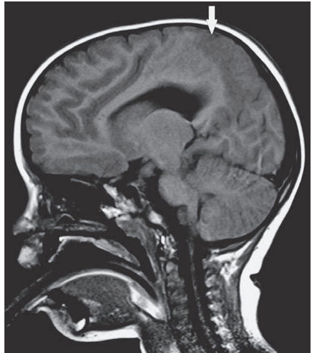
SLIKA 4 B. Sagitalni presjek MRI-a mozga drugog bolesnika (lijeva hemisfera). Siva tvar (strjelica) i bijela tvar su stanjene, s reduciranom giracijom postcentralnog dijela lijevog parijetalnog režnja.

nog razvoja mozga, a prikazuje se kao operkulum sindrom. Kod drugog bolesnika uočena je obostrana pahigirija. Oba dječaka imaju neurološki razvoj kompliciran primarno motoričkim odstupanjima u smislu cerebralne paralize, i to kod obojice jednostrane spastične (9-11). Oba dječaka imaju žarišno promijenjen EEG, što nosi povećan rizik za razvoj epilepsije, ali još ni jedan nije imao konvulzije. Također, obojica imaju poteškoće u govorno-jezičnom razvoju. Bolesnici su bez dizmorfije pa je isključena povezanost s neurogenetskim sindromima.