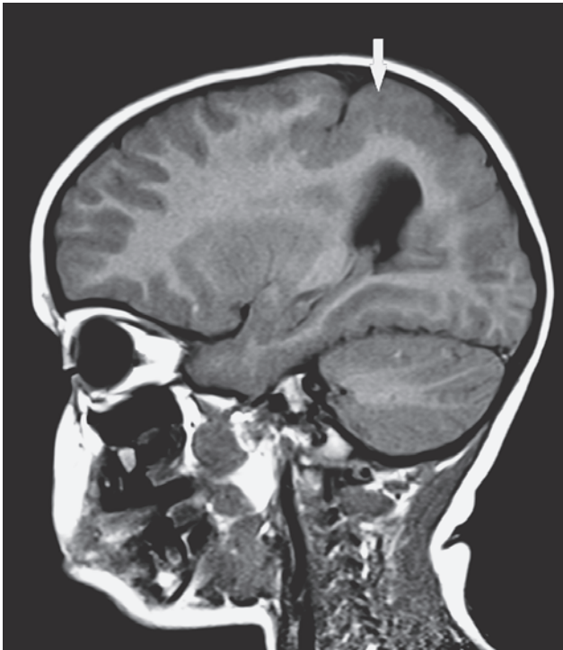
SLIKA 4A. Sagitalni presjek MRI-a mozga drugog bolesnika (desna hemisfera). Stanjena siva moždana tvar i reduciran broj sulkusa u postcentralnom dijelu parijetalnog režnja (strjelica)