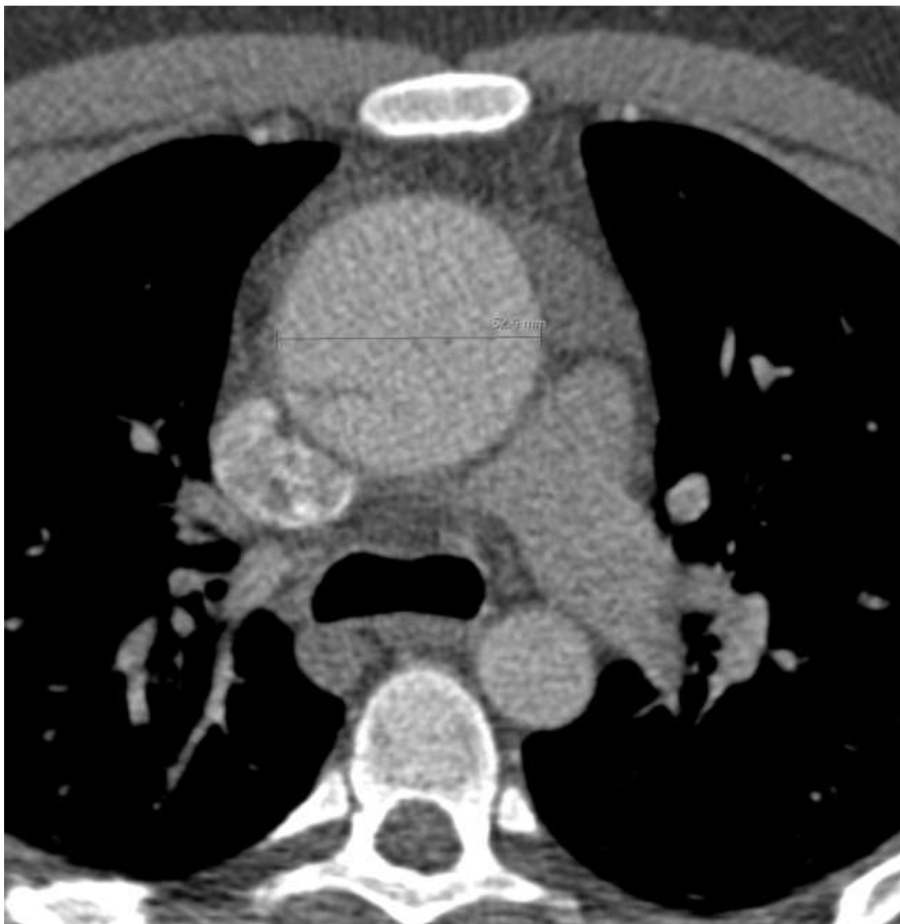
Slika 1. Značajno proširenje ascendentne aorte Picture 1 Significant expansion of ascending aorta

Bolesnik je nakon dva tjedna otpušten na rehabilitaciju i daljnje ambulantno liječenje. Na kontrolnim pregledima je bez tegoba s kliničkim kardiološkim nalazom bez odstupanja od fiziološkog, a UZV-om srca nađen je širi korijen aorte 38 mm, s urednim sistoličkim protokom i naznačenom aortnom regurgitacijom, širina grafta 30 mm, lijevi ventrikl (LV) uredne veličine i sistoličko-dijastoličke funkcije. Evidentira se i manji perikardni izljev ispod stražnje stijenke LV.